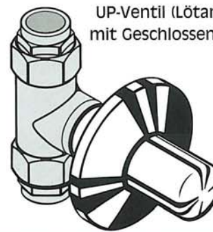
UP-Ventil (Lötanschluss) mit Geschlossene Kappe