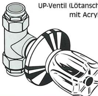
UP-Ventil (Lötanschluss) mit Acrylgriff