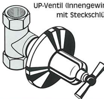
UP-Ventil (Innengewinde) mit Steckschlüssel